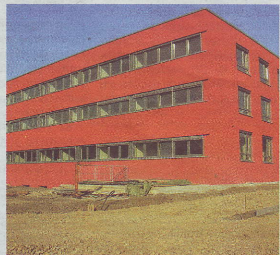
Bauabschnittsbilder von Beginn bis zur jetzigen Fertigstellung des W.E.I.Z. II in der Franz-Pichler-Straße.